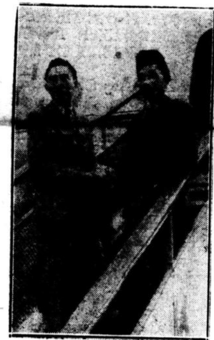
S.P. Susuhunan dan S.P. Mangkunegoro digambar ditangan pesawat terbang di Kemajoran, sewaktu akan berangkat ke negeri Belanda pada tgl. 9 Aug jbl, sebagai penasihat dari delegasi Indonesia.

Selanjutnya Anep dari den Haag mengabarkan bahwa van Kleffens permulaan pekan depan dinantikan kedatangannya di den Haag untuk mengadakan pembitjaraan sewaktu2 yang biasa.